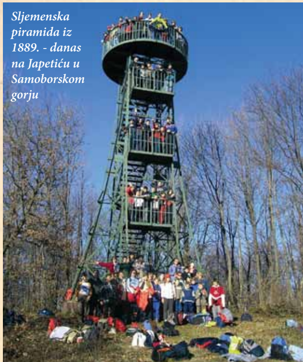
Sljemenska piramida iz 1889. - danas na Japetiću u Samoborskom gorju

Ovdje ne možemo prešutjeti hrvatsko planinarstvo u Bosni i Hercegovini. Kao što je u ovom časopisu već istaknuto (Povijest hrv. športa, 44, br. 160, 2012, str. 6-9), protagonisti planinarstva u toj zemlji bili su Hrvati (i pohrvaćeni stranci koji su došli iz Austro-Ugarske). Planinarstvo je tvorevina