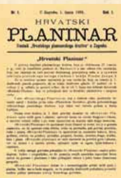
Prvi broj „Hrvatskog planinara“ iz 1898.

Prvu četvrt stoljeća HPD se od ostalih planinarskih društava u svijetu razlikovao po naglašenim kulturnim i znanstvenim zadacima. Naime, gorska Hrvatska bila je tada puna nepoznanica i najprije ju je trebalo istražiti. Prvi predsjednici HPD-a bili su uglavnom istaknuti znanstvenici. Dr. Josip Schlosser (1808.-1882.) bio je