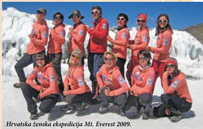
Hrvatska ženska ekspedicija Mt. Everest 2009.

Dom na Sljemenu imao je tragičnu povijest. Prvi Tomislavov dom nastao je 1925. prigradnjom staroj sljemenskoj društvenoj kući, a kako se te godine slavila tisućljetnica hrvatskog kraljevstva nazvan je Tomislavovim domom. Nažalost, ta golema drvena zgrada do temelja je izgorjela 1934., nakon čega je velikom sabirnom akcijom po cijeloj Hrvatskoj („Jedan dinar za jednu ciglu“) skupljen novac za novi Tomislavov dom. Sagrađen je 1937. po zanimljivoj