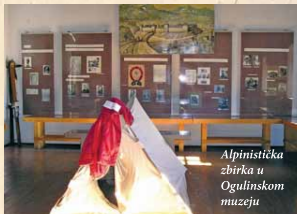
Alpinistička zbirka u Ogulinskom muzeju

zapadne kulture i oni su je presadili na tlo BiH. Pripadnici istočnih kultura (Bizanta, islama) prihvatili su planinarstvo mnogo kasnije. To najbolje ilustrira podatak da su dva najveća planinarska društva u BiH (Društvo planinara u BiH i HPD sa svojim podružnicama) bila do 1940., kada su se i sjedinila, pretežito ili posve hrvatska. Prvo društvo imalo je na vrhuncu razvoja oko 1500 članova, 8 podružnica i 17 kuća, a HPD je u BiH imao 7 podružnica i 6 kuća. Gotovo sve je uništeno u ratu, a zatim pola stoljeća, sve do krvavog raspada Jugoslavije, nije bila dopuštena obnova starih društava (osim ljevičarskog „Prijatelja prirode“).