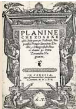
Naslovna stranica Zoranićevih „Planina“

Poslije znanstvenika, predsjednik HPD-a tridesetak godina (sve do konca Prvog svjetskog rata), bio je grof Miroslav Kulmer (1861.-1943.), poznat kao darežljivi mecena. Među ostalim, dao je 1898. o svom trošku sagraditi put od Kraljičina zdenca na vrh Sljemena. Planinari su taj put u znak zahvalnosti nazvali imenom njegove supruge – Elvirinim putom, a književnik Franjo Marković ispjevao je tom prilikom odu zahvalnicu. Markovićeve je zasluga da je HPD 1898. pokrenuo svoj mjesečnik „Hrvatski planinar“ koji – to valja posebno istaknuti – još i danas izlazi pod istim imenom. I ne samo to, nego je 2008. svih stotinu njegovih godišta u cijelosti digitalizirano, amaterski pothvat kakav dotle u Hrvatskoj nije uspio ni profesionalnim ustanovama!